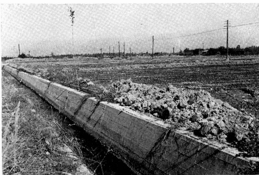
小松付近の農業構造改善事業 (41.11.4)