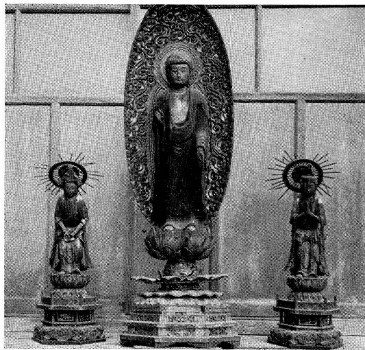
上米塚泉現寺阿弥陀如来とわきだち

た、幅広い旧河跡には、大川が現位置に固定してから、新田開墾が進み、俗に元和九年前後から、この流域に十二新田が開発されたと伝えられている。 上米塚新田はもと出新田といって、寛永三年（一六二六）に開拓した。その開