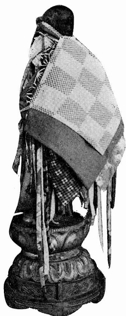
上米塚延命地藏尊