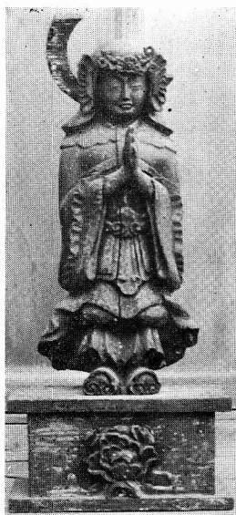
上米塚泉現寺の韋駄天像