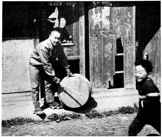
今和泉村の区長が、村休みの合図を打ちならす太鼓

い、水かけ、代かきから収穫まで行なっている、灌漑用水の統制が強化されている地方では、ある程度の労働統