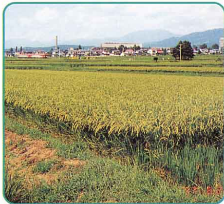
▲ 豊かにみのった水田

北の方にある ふくしまちく 福島地区ではアスパラの さいばい さいばいがさかんであり、 こわ 強 しみずちく 清水地区ではそば、トマト、きゅうりなどの畑も見られます。