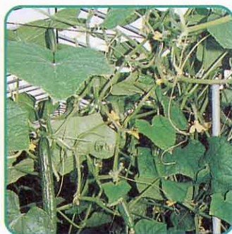
▲ きゅうりのハウス栽培 さいばい