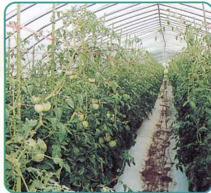
▲ せいしょく 生食トマトのハウス栽培 さいばい