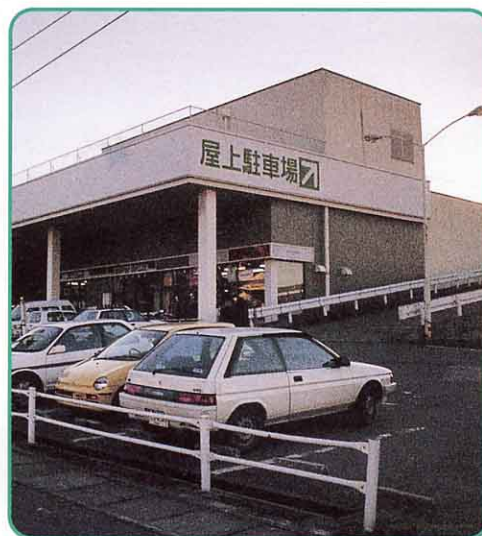
▲ スーパーマーケットの駐車場

また、ほかの商店も、お客が車でかんたんに買い物にすることができるよう ちゅうしゃじょう に店の前に駐車場を作ったり ひろたえきまえ 広田駅前に共同で使える駐車場を作ったりしています。