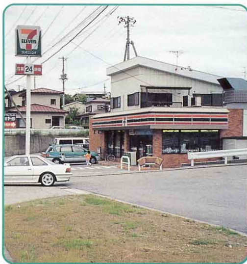
▲ コンビニエンスストア