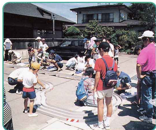
▲ ふるさとふれ愛市のようす