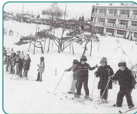
▲ 河っ子の丘でのスキー練習