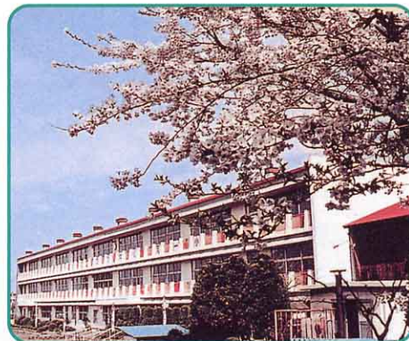
▲ 新しくなった校舎

1998年（平成10年）には、コンピュータ室の完成とともに、23台のコンピュータが入りました。