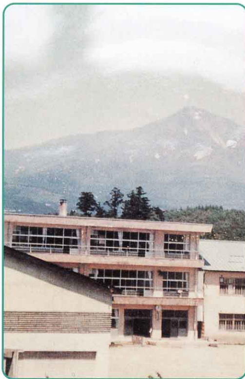
▲ 鉄きん3階だての校舎

1972年（昭和47年）にいっしょにあった河東第二中学校が河東中学校として統合されることになり広田にうつりました。そして、1973年（昭和48年）の春、強清水分校 こわしみず がはいしになり本校に統合 どうごう にされ、長い歴史をとじました。秋には、本校創立100周年記念式典 そうりつ しゅうねん きねんしきてん がせいだいに行われました。