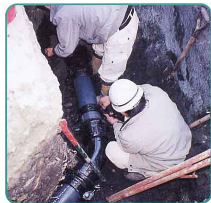
▲ 水道工事のようす

町では、1960年（昭和35年）に水道を 引く仕事が始まりました。その後徐々に 水道が広がっていきました。これから も安定して水を供給できるように水道管 をのばしたり、古くなった水道管を交換 したりしています。これは、役場の水道 課が中心となって進めています。