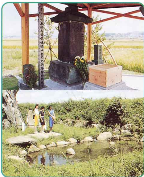
▲ 皆鶴姫と難波池 (一小地区)

わたしたちの河東町には、すばらしいものがたくさんあります。国や県、または町から指定を受けた数々の文化財、そして、美しい自然です。それらを生かして、観光の町づくりにつとめています。