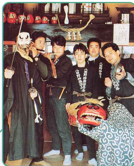
▲ 八田神楽 (二小地区)