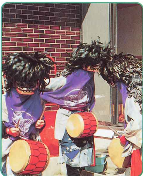
▲ 槻橋彼岸獅子 (一小地区)