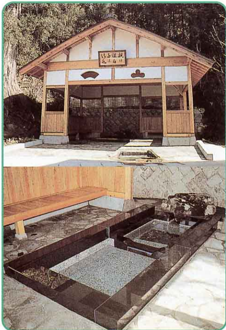
▲ こわしみず 強清水 (二小地区)