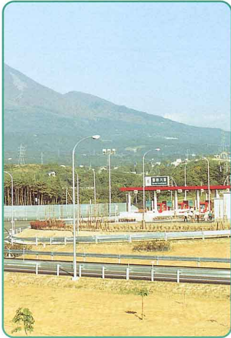
▲ ばんえつじ どうしゃどうばんだいかわひがし 磐越自動車道磐梯河東 インターチェンジ (二小地区)