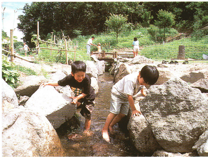
おおり公園内親水施設