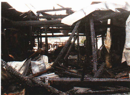
大寺地区の焼けた住宅