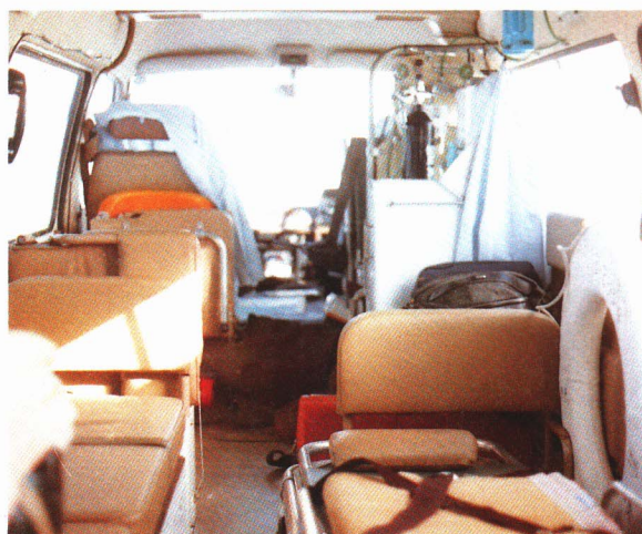
病人を運ぶ救急車のなか