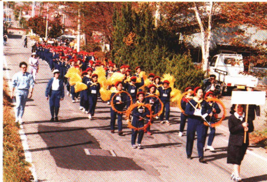
交通安全パレード