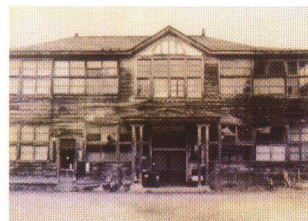
合併時の役場庁舎