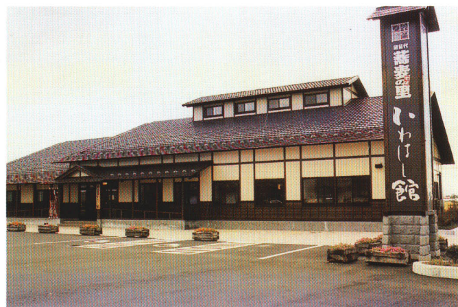
農林水産物直売・食材供給施設「いわはし館」