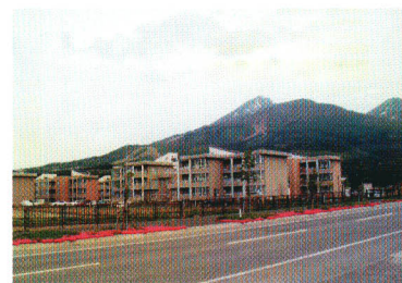
公営住宅(桜ヶ丘団地)