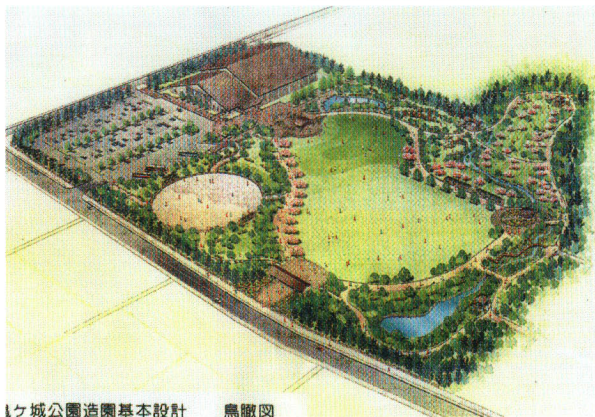
亀ヶ城公園造園基本設計 鳥瞰図