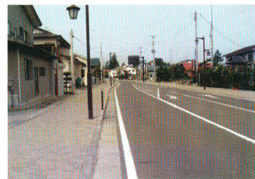
都市計画街路(猪苗代翁島線)