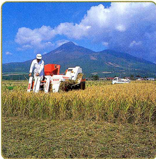
秋(翁島地区) おきなじま