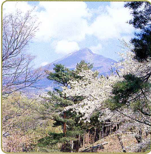
春(亀ヶ城) かめがじょう