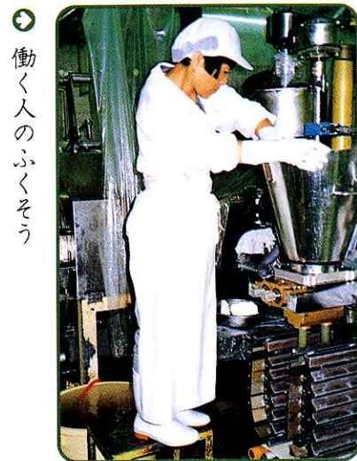
② 働く人のふくそう

このようにすると、つくったままのおいしさで、新鮮さを失わず、各地に送り出すことができます。