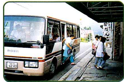
① バスで工場にかよってくる人