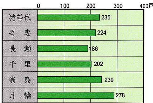
地区ごとの農家の数 (1995年世界農林業センサス)