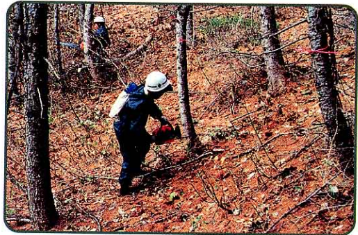
⑦ 間ばつ(じょうぶに、まっすぐ育たない木を切る)