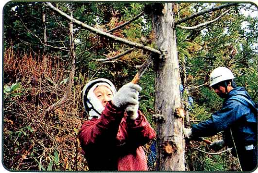
④ 枝打ち(よけいな枝を切り取る)