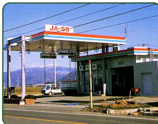
④ ガソリンスタンド (月輪)