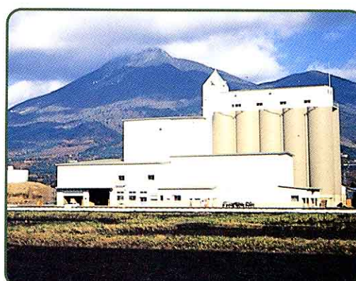
⑥ カントリーエレベーター