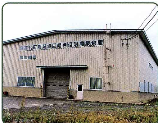
③ 農業倉庫 (翁島)