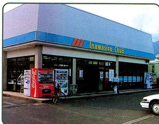
⑤ JA福島食品 Aコープ猪苗代中央店