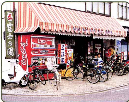
④ おきなじま 翁島地区