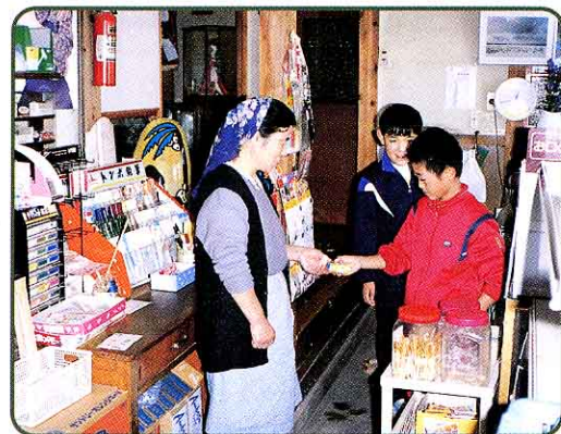
④ ちきと 千里地区