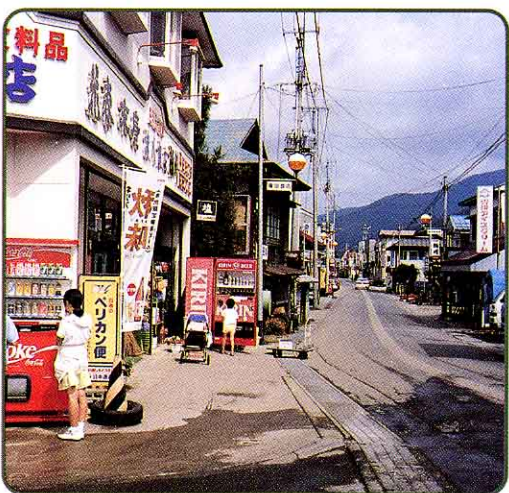
➡ 川桁商店がい かわげた