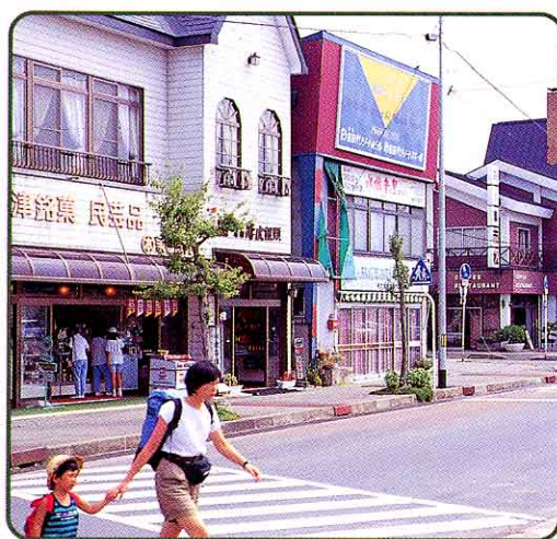
➡ 駅前商店がい えき