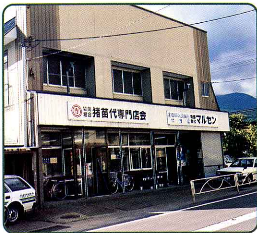
猪苗代町専門店会

このほか、旅行 りょこう の計画 けいかく ・磐梯まつりお楽しみ抽せん会 ちゅう ・たくさん の人が楽しめるショー ろうじん ・老人ゲートボール大会 かさい ・火災やスポーツなどの 保険 ほけん の仕事 しごと ・お金 そうだん についての相談 さうだん なども行 おこな っています。