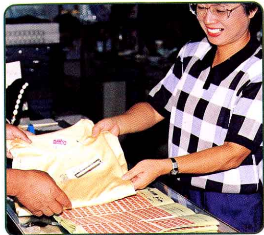
シールと品物の交かん