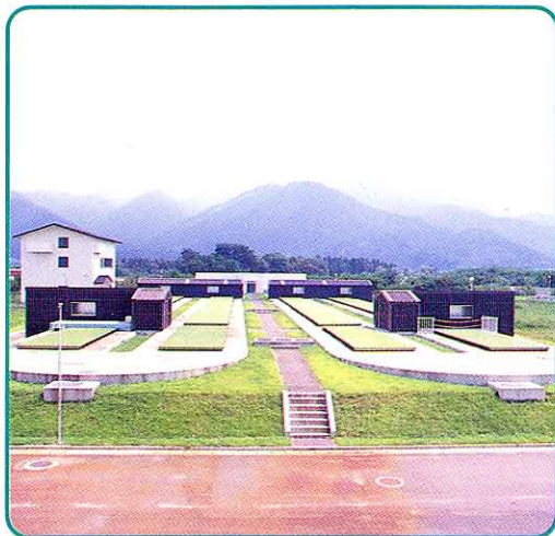
④ 猪苗代町じょうかセンター(茜館)