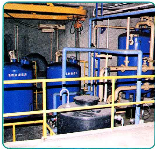
④ よごれたものをきれいにするそうち