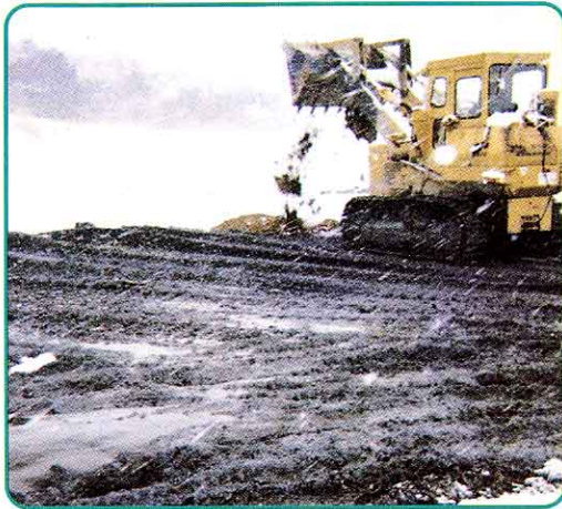
④ もえないごみのうめたて地

古くなった自転車やわれたガラス・清掃プラントでもえのこったはいなどがうめたてられています。