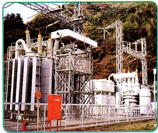
へん でん しょ 変電所 電あつを変える