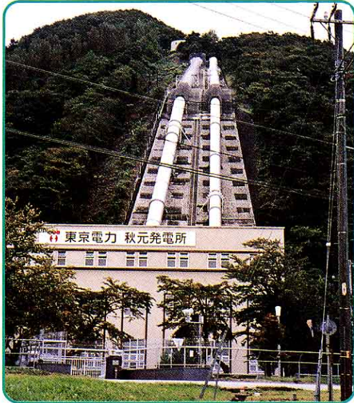
あきもと はつ でん しょ 秋元発電所 電気をつくる