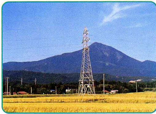
そう でん せん てい 送電線と鉄とう 高い電あつで電気を送る。

家の近くの電柱 ⬅ ちゅうじょうへん 柱上変あつきで電気を下げ、ひきこみ線を通して家庭に送る。