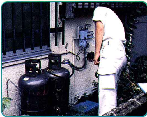
④ 外のボンベや安全を守るきぐのてんけん

ガスは、べんりなものですが、もれると、中どくやばく発、火事などのおそれもあります。それで、いつも安全てんけんにつとめています。