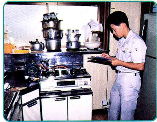
④ ガスを使うきぐのてんけん