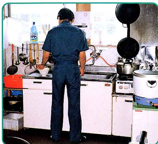
📍 だいどころ 台所