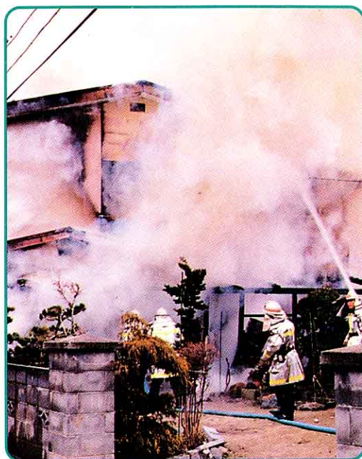
📍 しょうぼう 消火活動