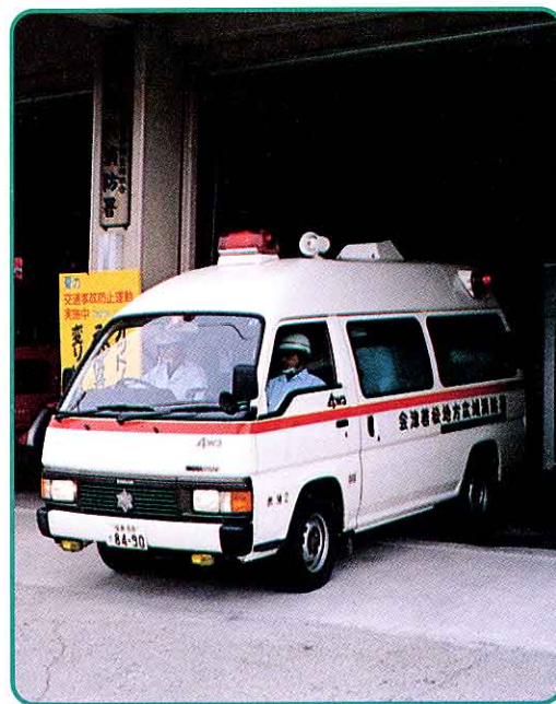
📍 きゅうきゅう 救急車の出動