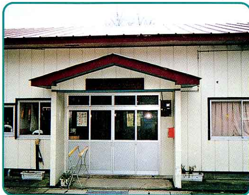
なかのさわ 中ノ沢保育所 (中ノ沢)