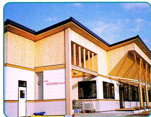
かわづた 川桁保育所 (川桁)