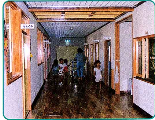
いなわしろほいくしよ (城南) 猪苗代保育所