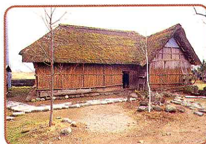
○ 旧馬場家住宅 建造物

南会津郡伊南村から1974年(昭和49年)に、今の場所に移されました。この住宅は、当時の農家の生活を知る大きな手がかりになります。