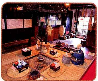
♣ いろいろとじざいかぎ