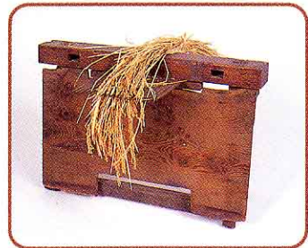
♣ せんばこき (いねこきをする道具です)