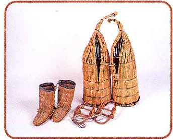
♣ わらぐつやふみだわらかんじき