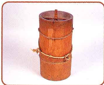
♣ するす (もみすりをすると使いました)