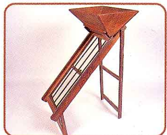
♣ 万石 (玄米に分けるとき使いました)