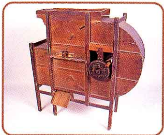
♣ どうみ (こくもつをふり分けるのに使いました)