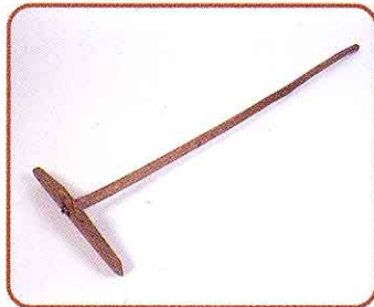
♣ えんぶり (田の表面をならすのに使いました)