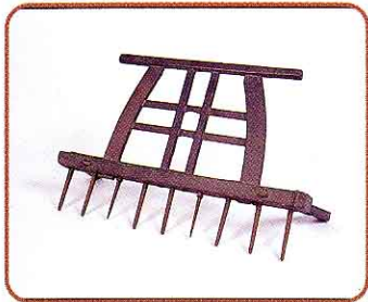
♣ 馬ぐわ (代かきのとき、馬にひかせ土をほぐしました)