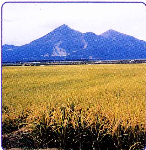
⊕ 豊かな実り ゆたかなみの

わたしたちの住む猪苗代町には、猪苗代湖・磐梯山などがあり、た いへん自然にめぐまれています。そのほかにも、数々の文化財や野口 英世のようなかがやかしい活やくをした先人たち、そして豊かな実り をもたらす田畑があります。それらをわたしたちの祖先は大切にし、 守ってきました。わたしたちもこの自然が豊かな町をいつまでも守り 続けていかなければなりません。そのためには、猪苗代町をもっとよ く知り、住んでよかったと思える町にするように努力しましょう。