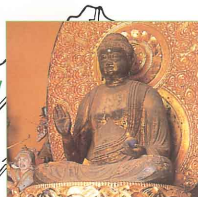
もくぞうやくしによらいぎぞう ①木造薬師如来坐像 (中善寺・関柴町)