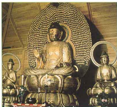
もくぞうあみだによらいおよびりょうきよじ ①木造阿弥陀如来及両脇侍 坐像 (願成寺・上三宮町)