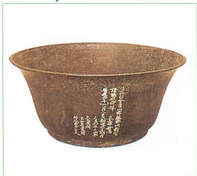
どうばち くまのじんじゃ けいとく ①銅鉢 (熊野神社・慶徳町)