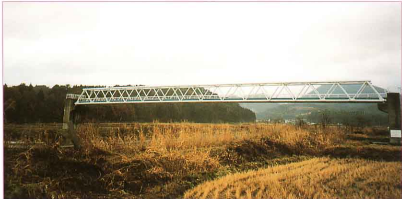
①川をわたる送水管