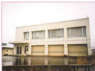
①喜多方市の水道課 すいどうか