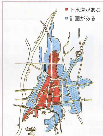
市の下水道の計画②