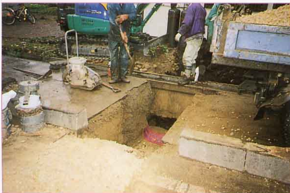
①下水道工事の様子

市では、早く多くの方が下水道を使えるようにするため、計画を立てて、工事を進めています。