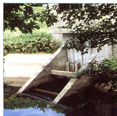
とりいれぐち ②新しい取入口