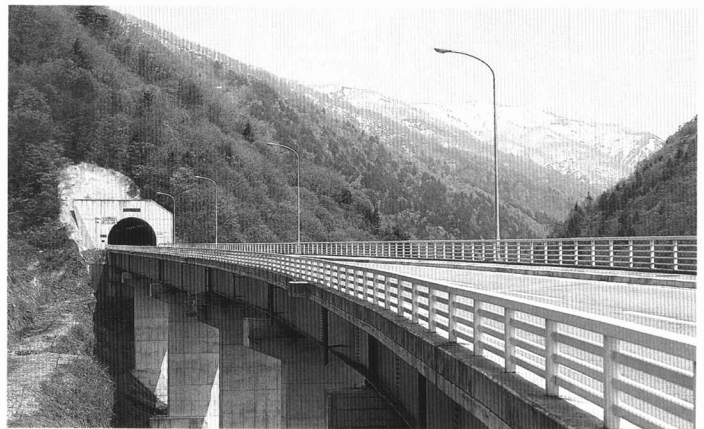
国道121号線大峠道路開通（平成4年8月9日）