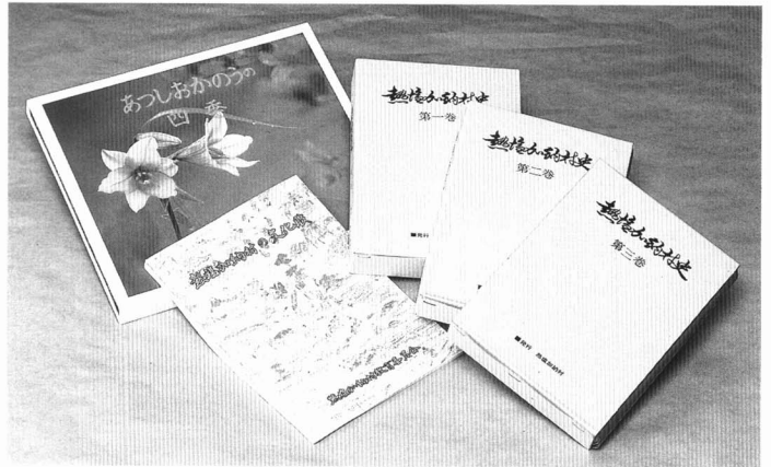
村史の発行（昭和51年～昭和57年）