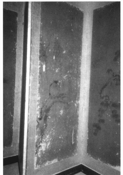
雪村画六曲屏風 針生・三浦主税家蔵 室町時代作、常陸の人 禪僧で宋元画を雪舟に学び東北画壇の中心人物であった