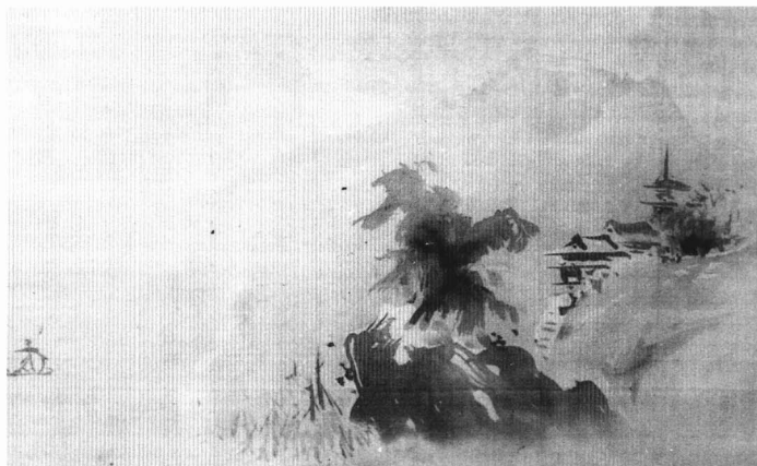
掛幅画・狩野探幽画 上野・三浦大輔家蔵 江戸時代初期の絵師狩野派中興の祖、幕府に仕え自派繁栄の基を築く

修験院号補任状 針生・佐原千代家蔵 修験宗天台系本山派支配頭京都聖護院門跡（熊野三山奉行）よりの法印院号免許状である