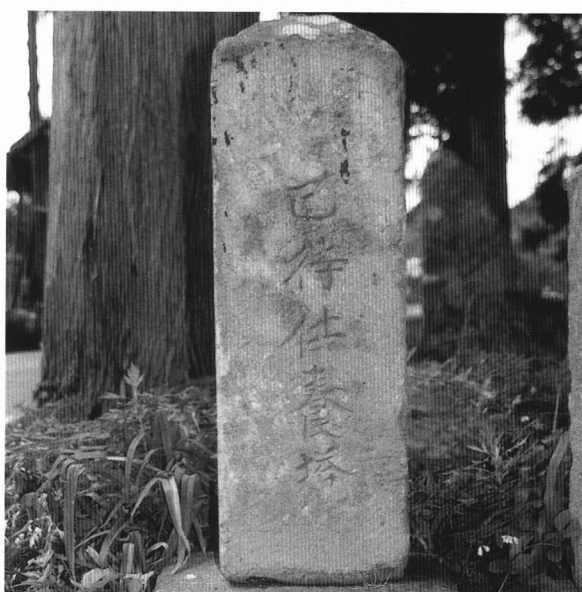
己侍供養塔・針生 享保20(1735).8.2 建立