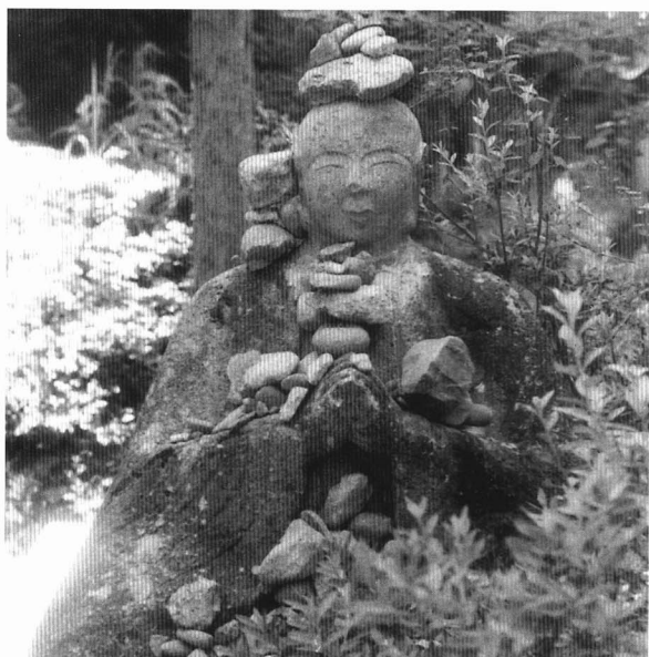
石地藏・熱塩、示現寺 安永2(1773).8.24 建立