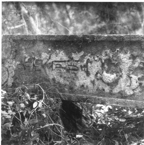
青面金剛明王碑・五目、蘇原 享保6(1721).10.3 建立