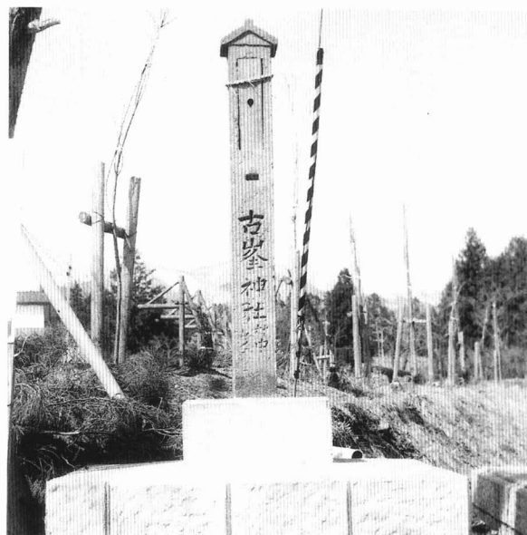
古峯神社・岩尾 明治22(1889).9 建立