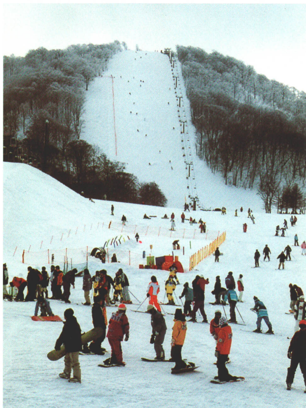
▲裏磐梯には裏磐梯猫魔スキー場、グランデコスキーリゾート、裏磐梯スキー場があり雪質、量ともによかれ、スキーヤーを集める。

魅力たっぷりの北塩原村は滞在して楽しみたい。標高850mの高原でスポーツができる「スポーツパーク桧原湖」、総延長が80kmにも及ぶ探勝路、冬のスキーや穴釣り、そして文化関係では資料館や美術館などがある。高原の魅力は一日や二日の旅行では味わい尽くせない。