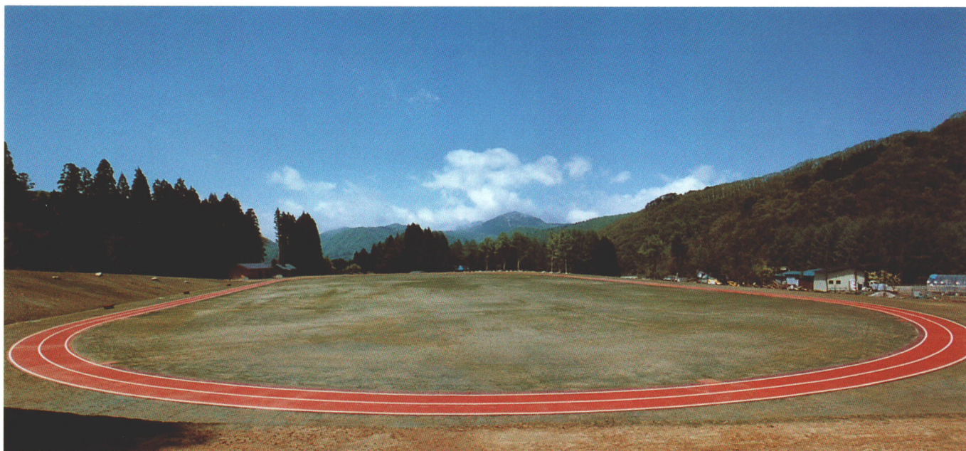
▲スポーツパーク桧原湖。全天候型 400mトラックコース、1Km クロスカントリーコース、ラグビー・サッカー対応グラウンドがある。吾妻川溪流探勝路、早稲沢・デコ平自然ふれあい探勝路が連結する。隣接して全天候型のテニスコート2面がある。