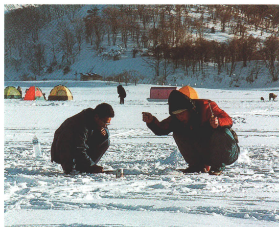
▲穴釣り。真冬に結氷する桧原湖などの湖沼ではワカサギの穴釣りが楽しめる。氷上にテントが張られ、未明には中の照明でテントが浮かび上がる幻想的な光景も見ることができる。