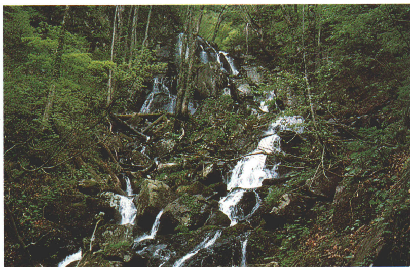
▲布滝。早稲沢・デコ平自然ふれあい探勝路の早稲沢口から約1.3kmの吾妻川にある。名の通り、清流に布を流したように見える。

裏磐梯には清流と滝が多く、写真家などに人気が高い。小野川不動滝をはじめ布滝や大塩川の大瀧、中津川溪谷には朱滝や魚止め滝、二階滝、横滝、熊落とし滝、夫婦滝などが“幻の滝”の如く並んでいる。遊歩道が未整備のため、登山や沢登り愛好者だけのスポットとなっているが、将来は探勝路整備の話もある。