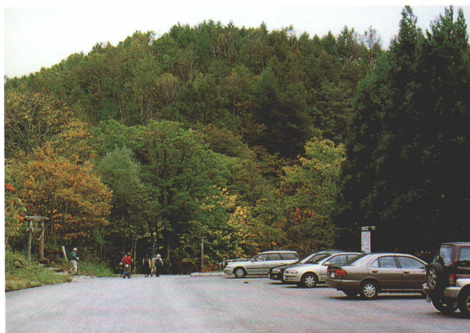
▲小野川不動滝入口の駐車場。滝への歩道入口の鳥居前にある。山伏修練の滝の歴史を感じさせる。

裏磐梯には清流と滝が多く、写真家などに人気が高い。小野川不動滝をはじめ布滝や大塩川の大瀧、中津川溪谷には朱滝や魚止め滝、二階滝、横滝、熊落とし滝、夫婦滝などが“幻の滝”の如く並んでいる。遊歩道が未整備のため、登山や沢登り愛好者だけのスポットとなっているが、将来は探勝路整備の話もある。