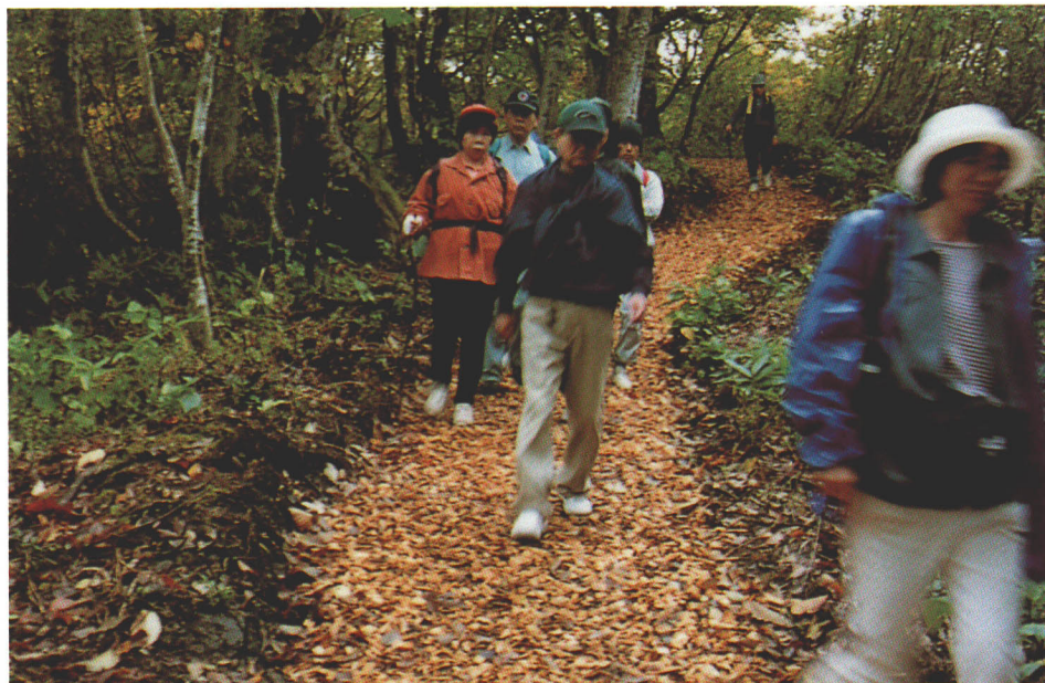
▲ウッドチップの探勝路。溪谷や湖沼近くの探勝路にはウッドチップが敷かれた道があり、自然を守る。