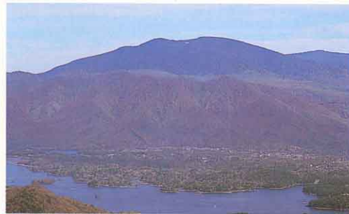
西吾妻山のやまなみ