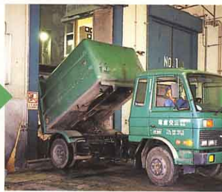
プラットフォーム