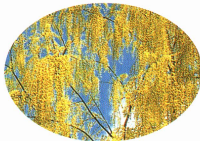
町の木 「柳 やなぎ 」

川にめぐまれたこの町には、やなぎの木が多く見られます。春早くねこの芽 め がはえて雪がふるまで、あおい葉 は をつけてがんばっています。