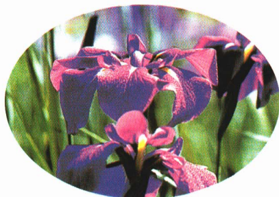
町の花 「花しょうぶ」

御 ご 殿 てん 場 ば 公 こう 園 えん にさきみだれる花 はな しょうぶ、その美 すがた しい姿 すがた や色 いろ 合 あ いは、広 ひろ く町 まち 民 たみ に親 した しまれています。