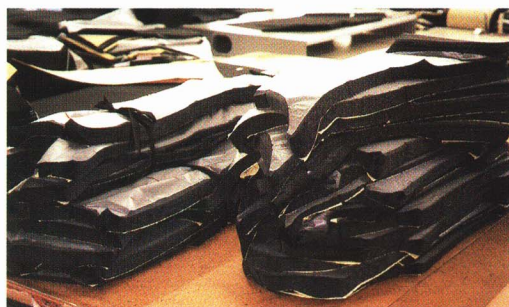
④ 切ったものをあわせる。