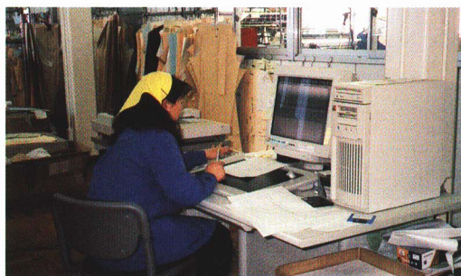
① コンピューターで型紙をつくる。(CAD)