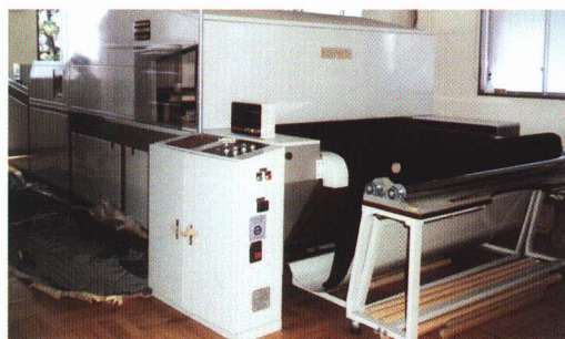
② 布のよりをなおす。(スポンジマシーン)