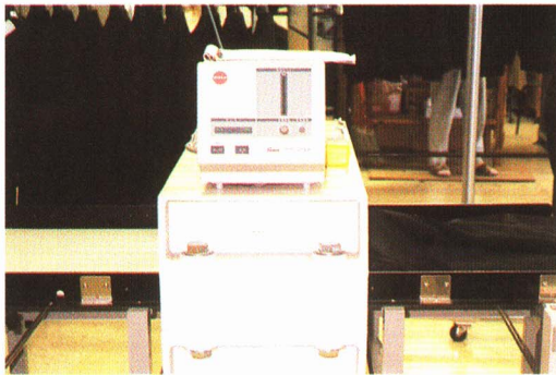
⑨ 服に針が残っていないかをけんさする。 (検針機)