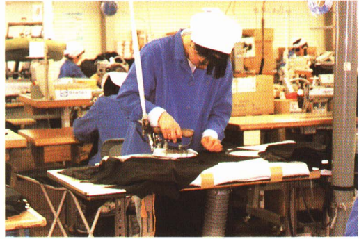
⑥ アイロンをかける。