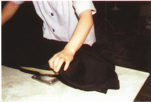
⑦ 各部分の仕上げをする。