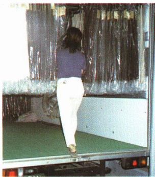
▲出荷 (ハンガー車で)